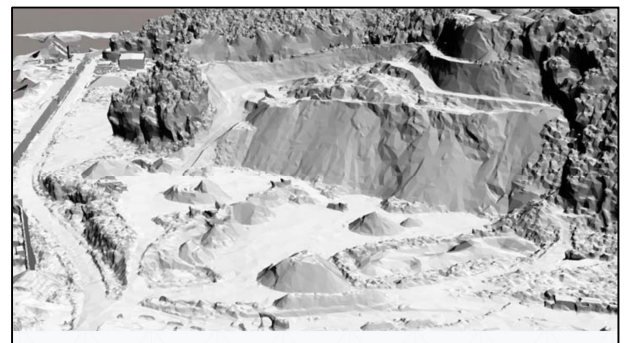
地形のサーフェスモデル

今回は「UAV 関連技術知識の共有化」として、①UAV (Unmanned Aerial Vehicle : 無人航空機) をとりまく現状と課題、②写真測量の原理と写真解析による 3D データ作成、③3D データによる横断面図と実測横断面図との比較検証事例、設計における景観検討事例等の発表がありました。